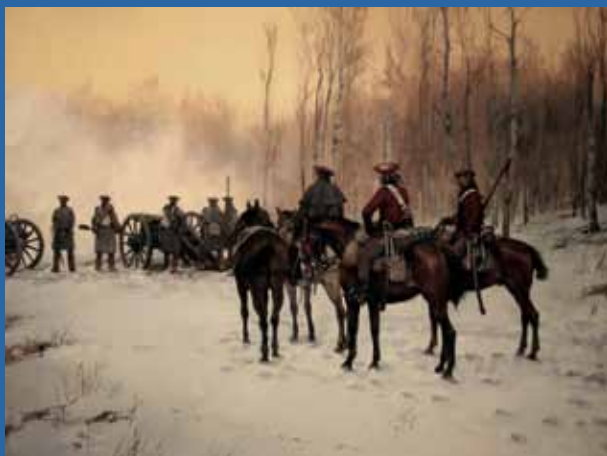
Augusto Ferrer-Dalmau, Artillería carlista . Colección particular.